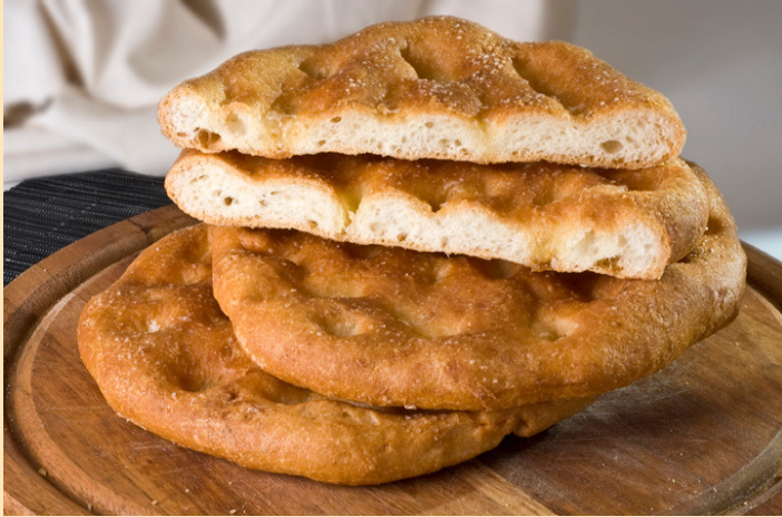
COCA EN SAL